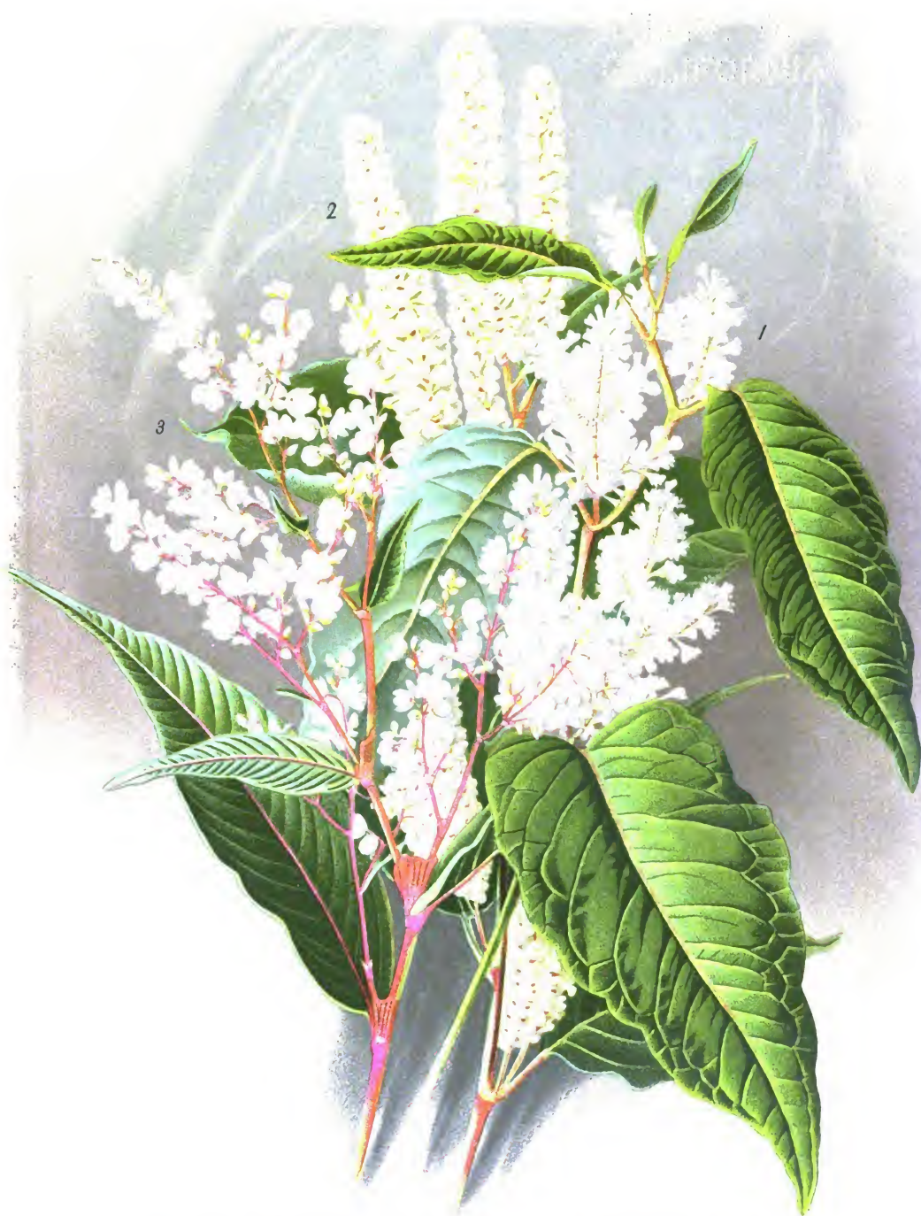
Polygonum polystachyum Wall. (1); Pol. compactum Hook. (2.)